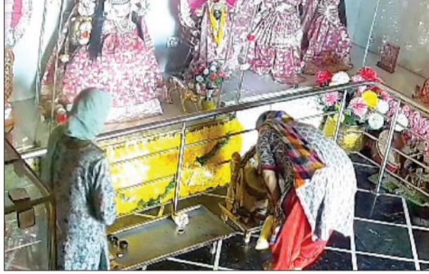
झज्जर। सीसीटीवी में कैद हुई प्रतिमा चोरी की वारदात।