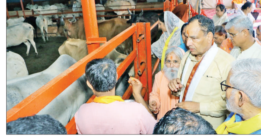
बहादुरगढ़। गोपूजा करते भाजपा प्रदेशाध्यक्ष मोहन लाल बड़ौली व अन्य।